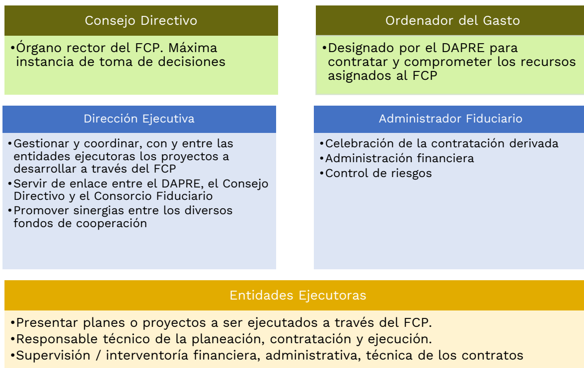
Figura 1. Instancias de gobernanza del FCP

la gestión de recursos es ágil y flexible; provee un marco institucional que además de optimizar el abordaje de las necesidades de la implementación, simplifica los trámites en términos de tiempo y recursos; y supera las limitaciones propias del régimen general de la administración pública como la vigencia fiscal. Las instancias de gobernanza actuales se detallan en la figura 1.