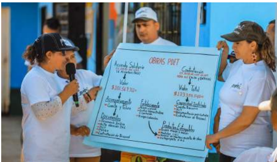
Socialización estrategia Obras PDET, 2019

De otra parte, desde la línea estratégica de estructuración, ejecución y cofinanciación del POA de la subcuenta y con recursos de la vigencia 2020 se han invertido $2.071 millones para contar con el personal que permita desarrollar la Fase II de Obras PDET en las que se han ejecutado 247 obras en 71 municipios PDET. Por otra parte, se contrató implementadores para la ejecución de obras para 13 regionales con el objetivo de atender 120 municipios PDET adicionales.