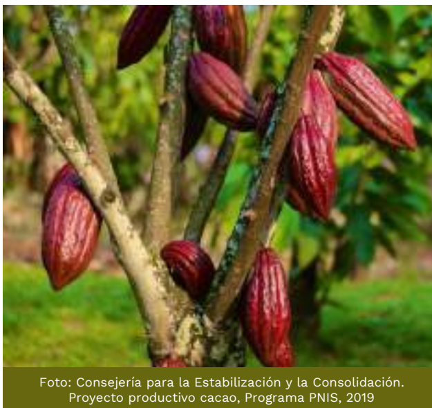
Proyecto productivo cacao, Programa PNIS, 2019

Finalmente, atendiendo que el Fondo Colombia en Paz es un patrimonio autónomo del DAPRE, la Oficina de Control Interno de la Presidencia de la República realizó auditoría interna de gestión al FCP para las vigencias 2017, 2018 y agosto de 2019, concluyendo en su informe presentado en el mes de enero de 2020 que la gestión y operación del Fondo se vienen desarrollando en el marco de los lineamientos, requisitos e instrumentos de planeación y control dispuestos por la Entidad.