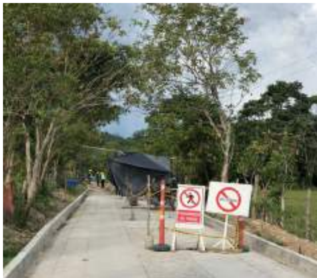
Foto: Fondo Colombia en Paz Obra PDET, Construcción de placa huella en Villagarzón,

Actualmente, el Fondo administra los recursos de una operación de crédito suscrita entre el Gobierno de Colombia y el BID (Préstamo 4424/OC-CO), a través de la que se financian proyectos con un enfoque hacia la sostenibilidad ambiental y socioeconómica de los municipios con Programas de Desarrollo con Enfoque Territorial (PDET). De igual forma, será el vehículo financiero para la implementación de un programa de inversiones del