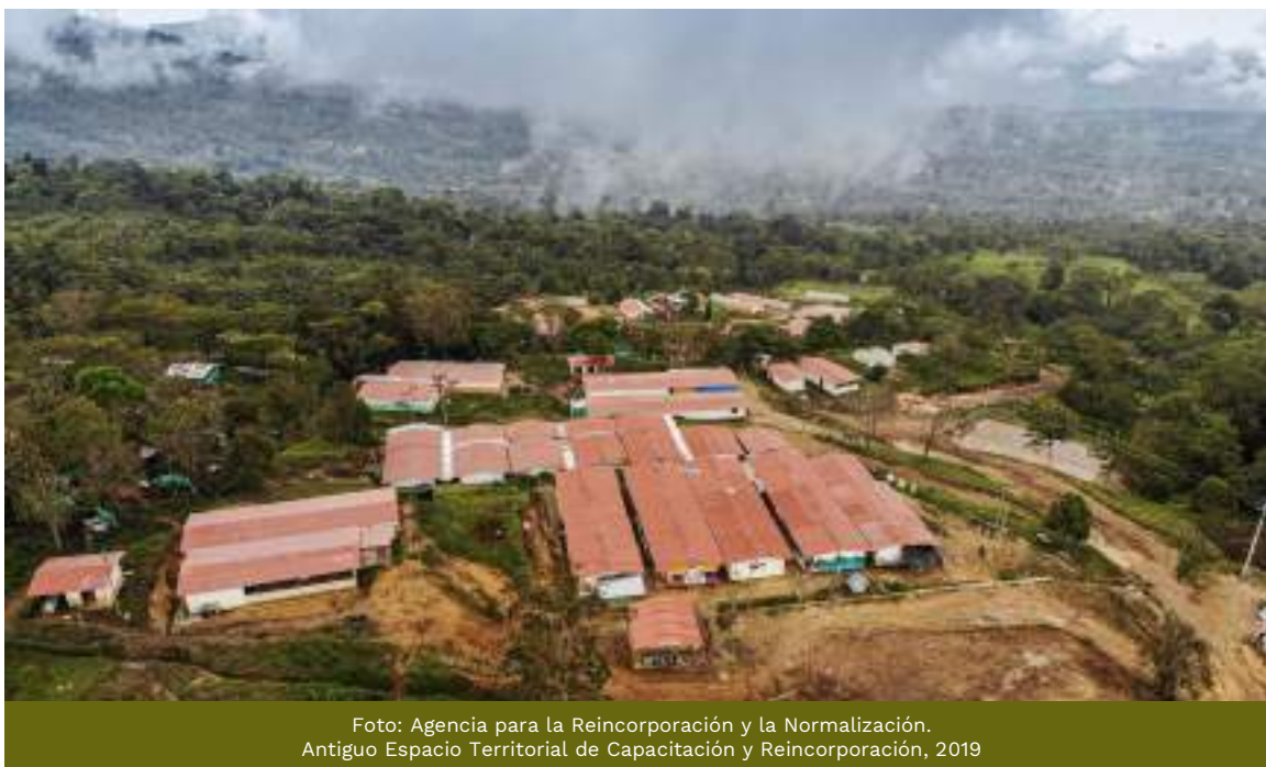
Antiguo Espacio Territorial de Capacitación y Reincorporación, 2019

De igual manera el Gobierno Nacional, comprometido con la reincorporación de los exintegrantes de las Farc-Ep, ha asegurado a través de los recursos de la Subcuenta el suministro de víveres secos y frescos en los 24 Antiguos Espacios Territoriales de Capacitación y Reincorporación (AETCR) y 25 áreas aledañas, beneficiando a 5.049 adultos y 1.334 menores , con el fin de garantizar su seguridad alimentaria. Para este fin durante el