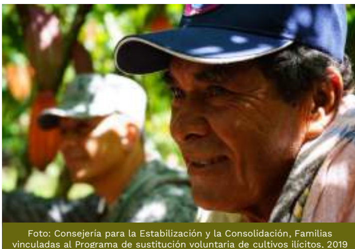
Familias vinculadas al Programa de sustitución voluntaria de cultivos ilícitos, 2019

De otra parte, se destaca que el proceso de contratación del FCP se rige por el derecho privado lo cual genera autonomía en la selección de los contratistas en corto tiempo. Bajo este régimen los procesos contractuales toman tiempos considerablemente inferiores 1 .