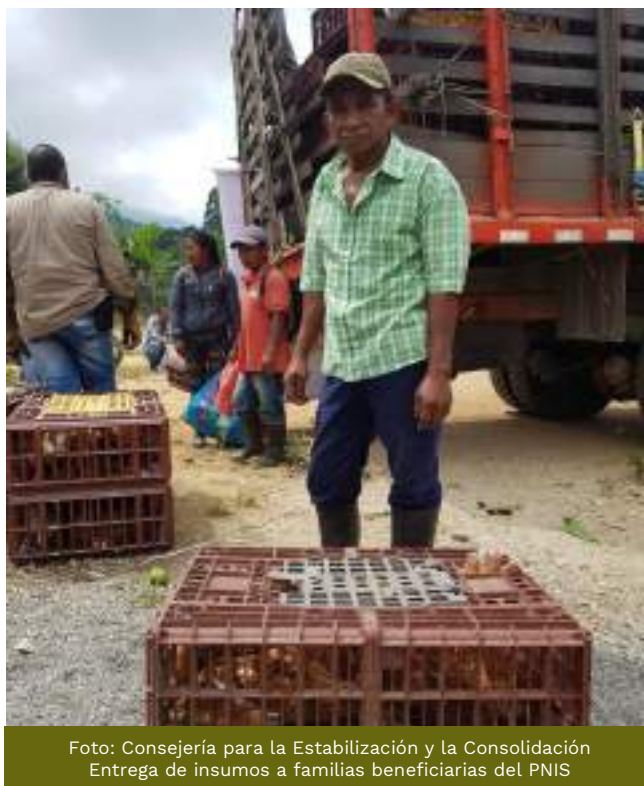
Entrega de insumos a familias beneficiarias del PNIS

Durante el primer semestre del año 2020 se han invertido $57.922 millones para la atención inmediata de familias desde el Programa de Sustitución de Cultivos Ilícitos y con los recursos que son canalizados por el FCP, para cumplir con el proceso de monitoreo se han invertido