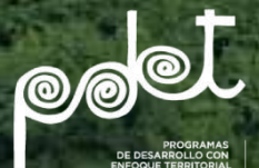
Putumayo, Colombia, 2019

PROGRAMAS DE DESARROLLO CON ENFOQUE TERRITORIAL